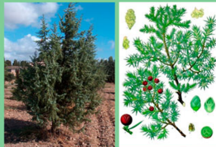
De Franz Eugen Köhler, Köhler's Medizinal-Pflanzen - List of Koehler Images, Dominio público, https://commons.wikimedia.org/w/index.php?curid=255360